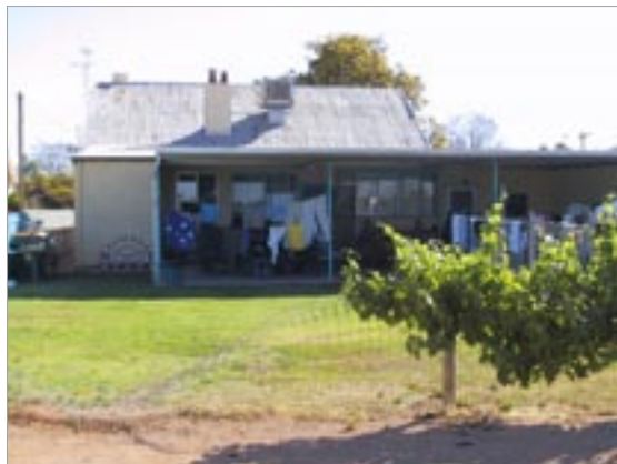
Hostellien näkö ja koko vaihtelee keskusojen wannabe-hotelleista pikkukaupunkien ”koteihin”.

Paikallispuheluita ja ilmaispuheluita soittaessa kännykkäoperaattorit perivät silti kännykkämaksun. Kolikkopuhelimet ovat monesti kännykkää edullisempia.