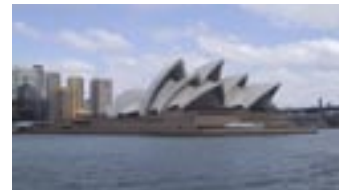
* Austrian Airlinesin halvin meno-paluulentopaketti Helsinki – Sydney 1200€.

Minkä tahansa tavan matkustaa valitsinkin – hyvää matkaa ja nauti Australiasta!