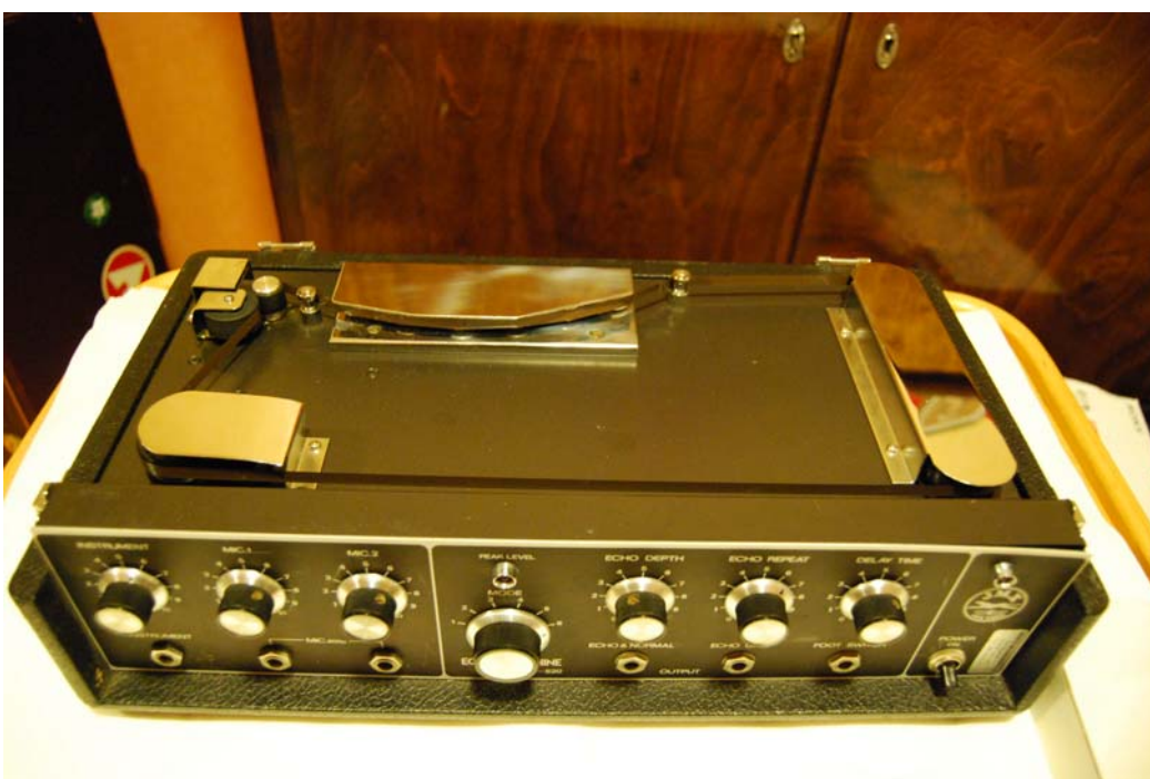
- Laite etuylhäältä...