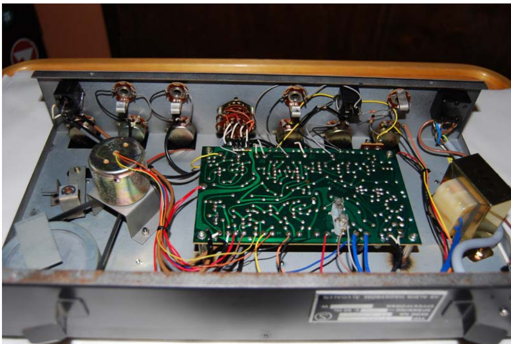
- Tässä näkyy mm. moottori joka on pikkulleen samaa tyyppiä kuin Pearlina Echo Orbitissa ja Vorgin vastaavassa...