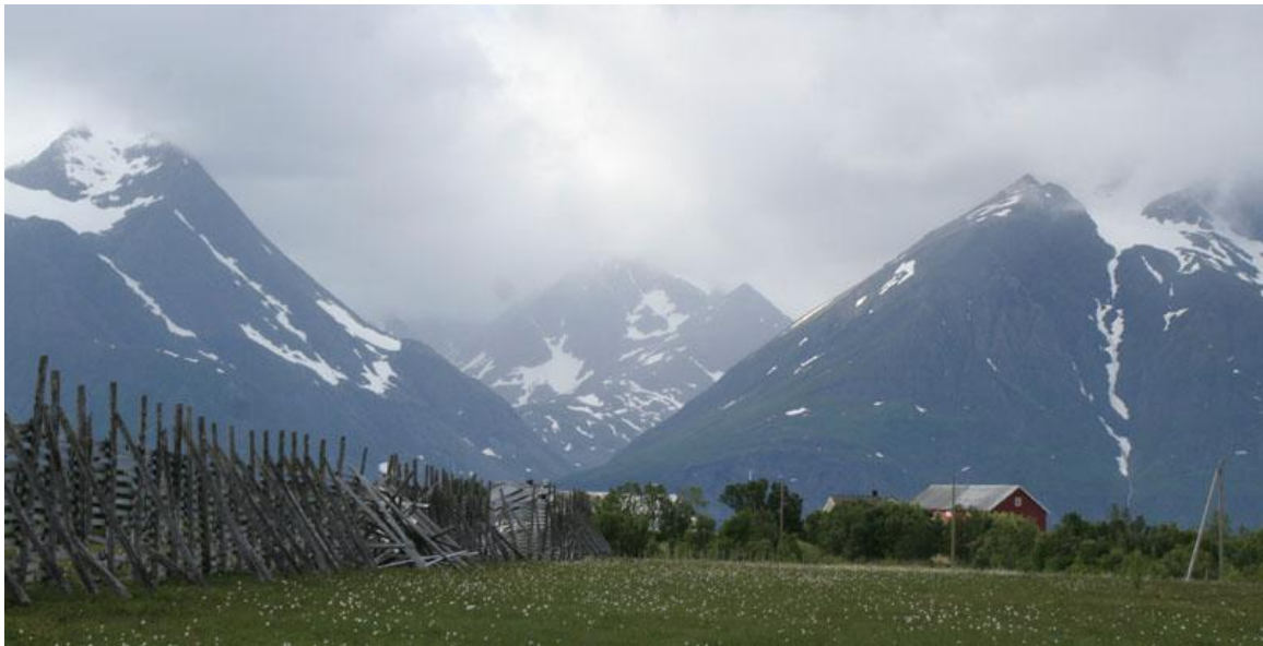
Spåkenesista zoomattua Lyngen vuoristoa Lyngen vuonon takana

Paikalla viihdyttiin yön yli ja ”saaliina” oli mm. ensimmäinen parvi punakuireja , pitkäkoipinen harmaahaikara , kookkaita pikkukuoveja ja merikihujen pesintä. Ja pullo punaviiniä.