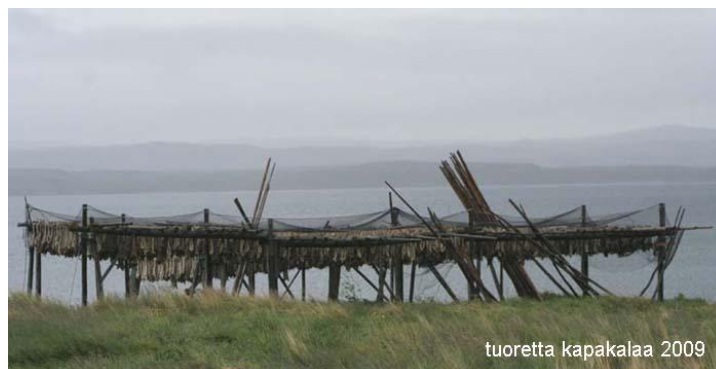
tuoretta kapakalaa 2009